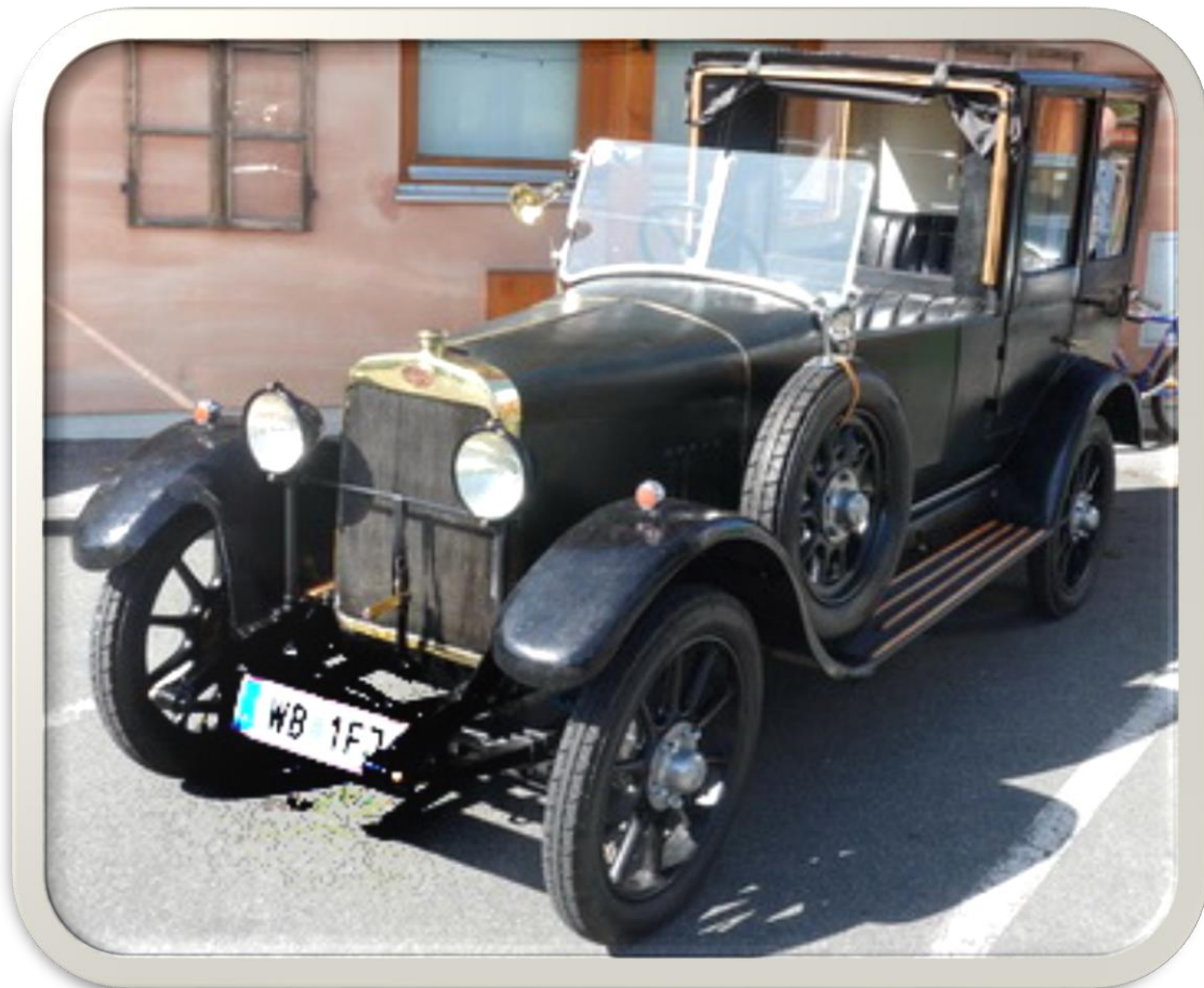
D & U Typ I – Baujahr 1924