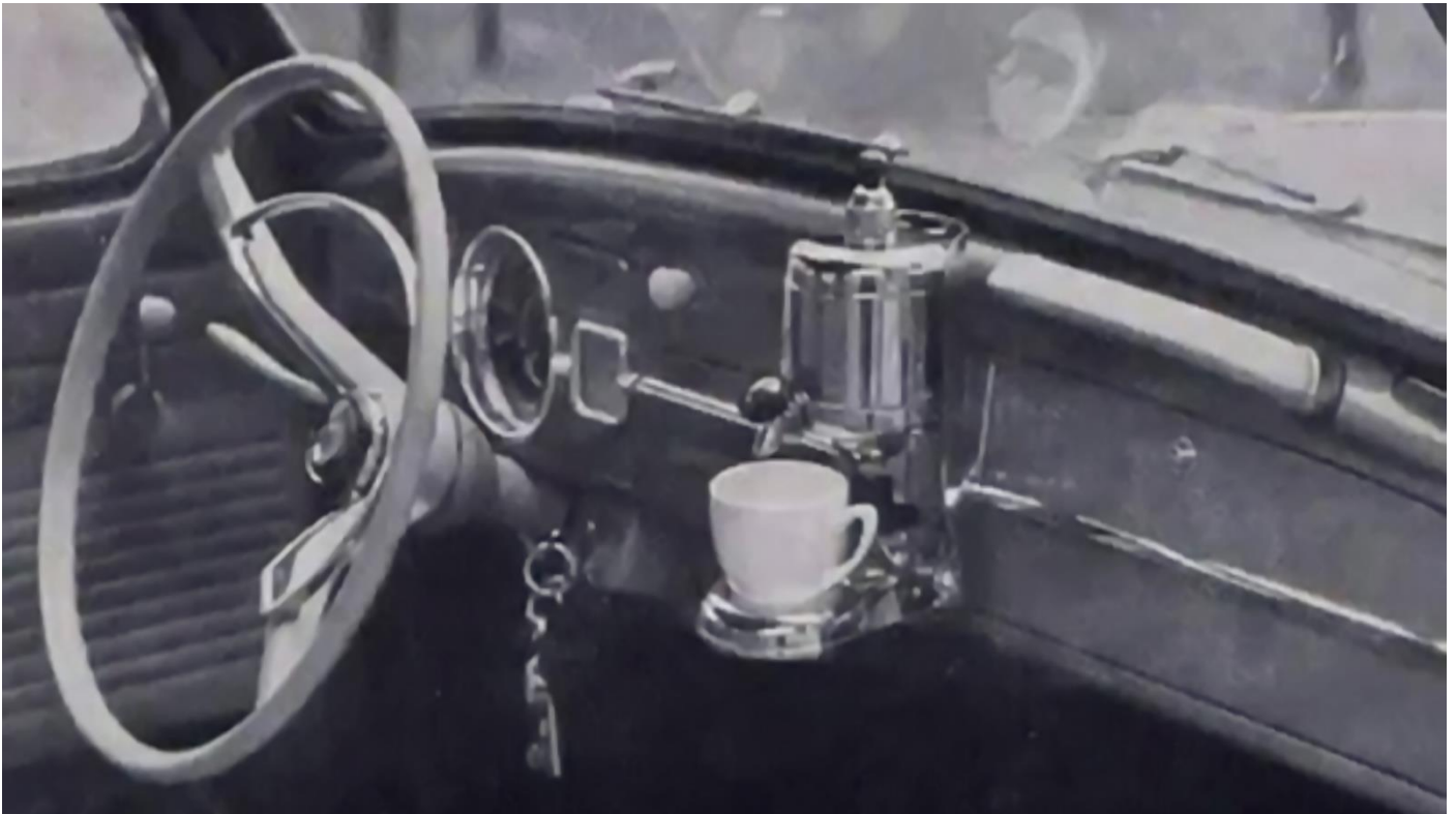
Paluxette Auto-Espresso aus den 60er Jahren.

Im VW Zubehörkatalog 1959 gab es eine Kaffeemaschine.