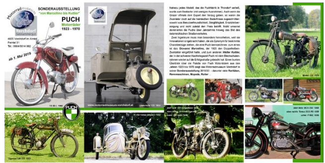
Der Flyer zur Puch-Sonderausstellung – Ausstellung nur noch heuer!