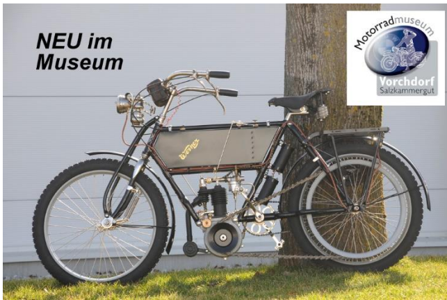
Neu auch die Werner 4 HP Grande Luxe aus 1905, die weltweit erste Maschine mit einem Parallel-Twin