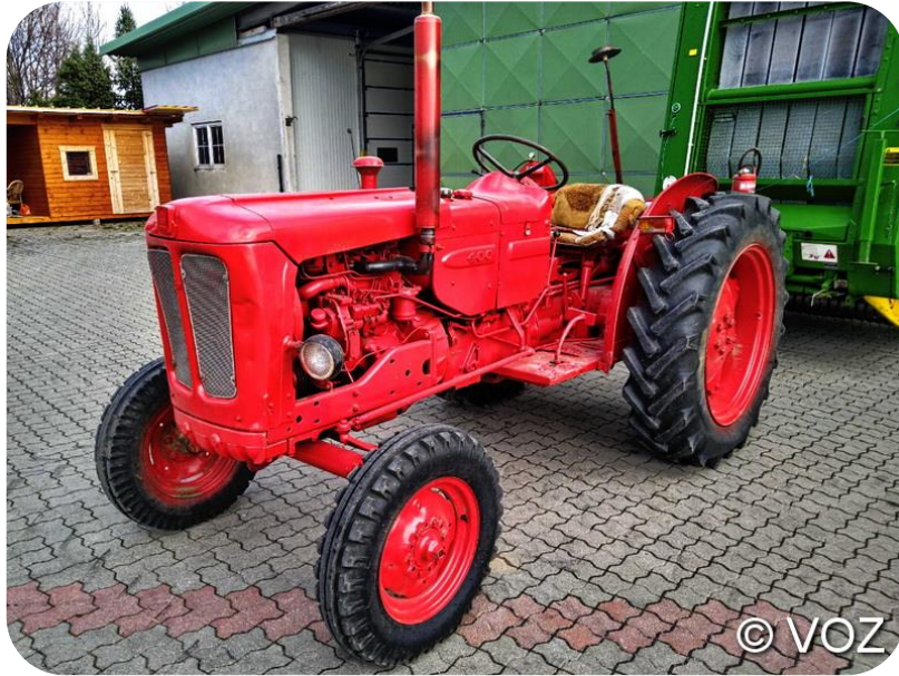
BM Volvo T - 400 Buster – Bj. 1966

Ps/kW: 42,5/32 bei 2.250 U/min, 3 Zylinder Viertakt Diesel Reihen Motor, 2500 cm 3 , Wassergekühlt, Eigengewicht: 1.860 kg, LxBxH: 3.140x1.680x2.100mm, Radstand: 2.100mm, Bauartgeschwindigkeit: 30,6 km/h, Nahfeldpegel: 89 Phon, Bauzeit: 1964 – 1969, Stückzahl: 22.589,